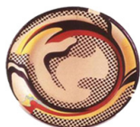
Associazione di promozione sociale "tutt'Altro"